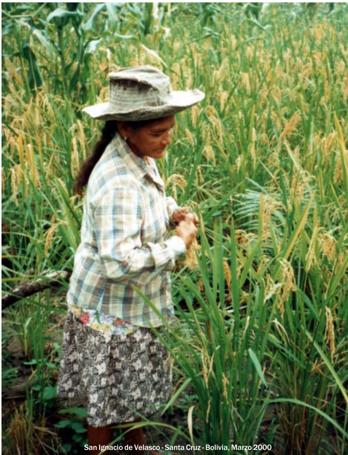
San Ignacio de Velasco - Santa Cruz - Bolivia, Marzo 2000

Tiene Personalidad Jurídica por Resolución Prefectural, No. 617/99 del 1 de Noviembre de 1999. Su domicilio legal es en San Ignacio de Velasco, Departamento de Santa Cruz y su área de acción abarca la Chiquitania.