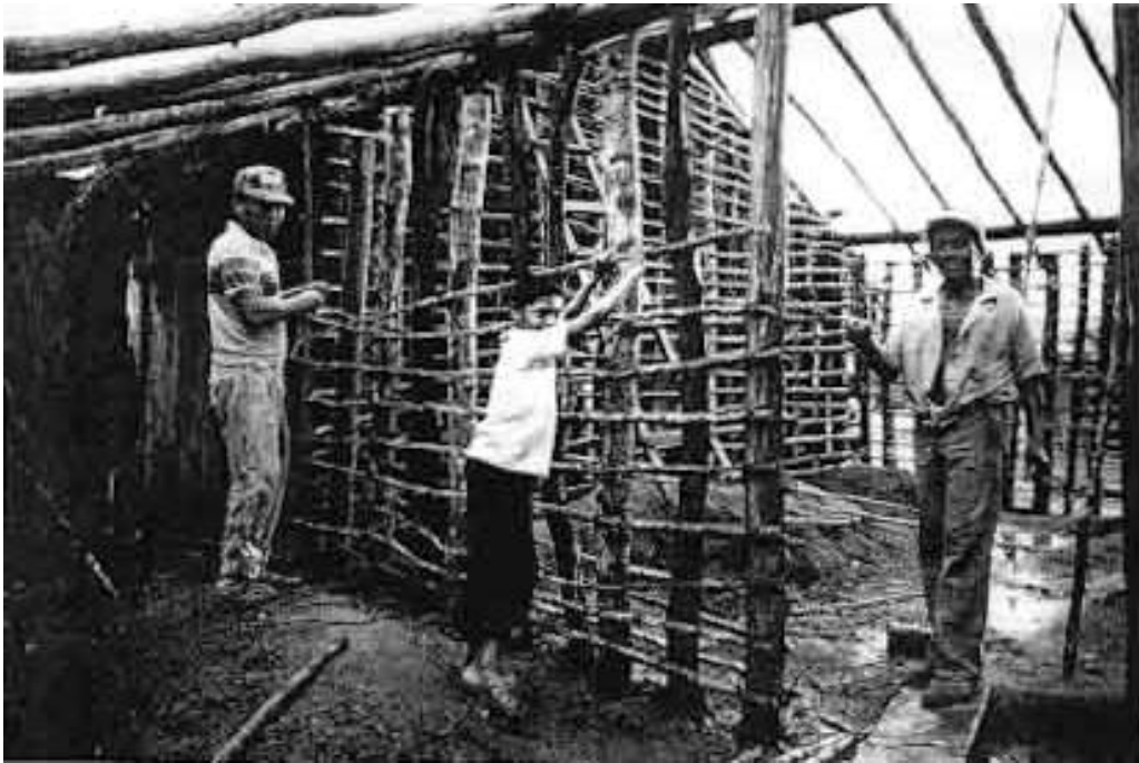
Abb. 94: Traditionelle Bauweise eines Chiquitano-Hauses: An die im Boden eingegrabenen Holzpfosten werden mit Güembe (eine Lianenart) Bambuslatten angebunden; die Zwischenräume werden dann mit Lehm ausgefüllt.

Tatsächlich ist der Chiquitano nicht nur Indianer und nicht nur Campesino, sondern er ist ein indianischer Kleinbauer , er bewegt sich in zwei Kulturen. Innerhalb der Dorfgemeinschaft ist er Indianer, sein Verhalten und sein Umgang mit den anderen Bewohnern folgt besonderen Regeln. Aber nach aussen hin kann er gegenüber den Nicht-Chiquitano als Campesino auftreten. Mit der Nationalgesellschaft kann er Geschäfte machen, mit den anderen Dorfbewohnern nicht. Zwischen Mestizen und Chiquitano kann ein entlohntes Arbeitgeber-Arbeitnehmer-Verhältnis bestehen, zwischen Chiquitano nicht.