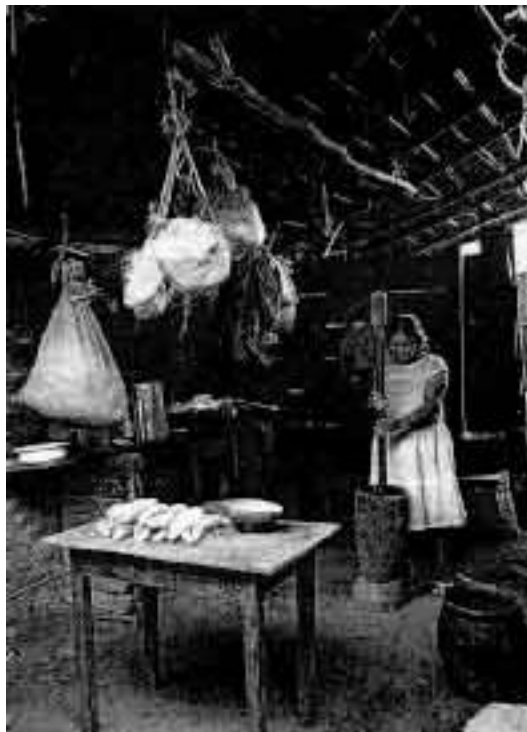
Abb. 96: Eine Chiquitano-Frau in ihrer Küche, mit dem Mörser (Katalog Nr. 95) verarbeitet sie Reis oder Maniok, in grossen Keramiktöpfen wird Wasser und Chicha (Maisbier) aufbewahrt, die Vorräte sind am Dach aufgehängt.

Diese Entwicklungen führen auch zu einer wachsenden Abwanderung in die Regionalzentren und in die Stadt Santa Cruz. Die Dorfgemeinschaften versuchen zu widerstehen und sich gegen die Angriffe zu wehren, aber ihre Ängstlichkeit gegenüber Autoritäten - Ergebnis ihrer historischen Erfahrungen - ist noch nicht überwunden. Und so sind ihre eigenen Organisationen noch schwach und werden von der herrschenden Gesellschaft nicht anerkannt. Noch gibt es keine indianische Organisation, die die Chiquitano als Volk vertritt und ihren Forderungen Gehör verschafft. Es fehlen auch noch alternative Projekte, die die Chiquitano in ihrem Wunsch, auf ihre eigene Art zu leben und zu denken, unterstützen und die versuchen, das Indianische mit dem Nationalen zu versöhnen. Und so drückt sich der Widerstand der Chiquitano gegen die Herrschenden nach wie vor darin aus, dass sie folgsam zuhören und so tun, als würden sie zustimmen, aber nachher nicht danach handeln.