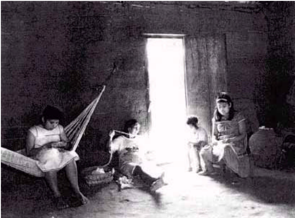
Abb. 93: Baumwolle spinnende Chiquitano-Frauen. Die Hängematten können tagsüber eingerollt werden.

Er wird von den Vertretern der Modernisierung eingeführt, obwohl er der Siedlungs- und Gesellschaftsform der Chiquitano widerspricht und nicht die herkömmlichen Baumaterialien verwendet. Viele Ortschaften sind heute in ein altes und ein neues Dorf gespalten; überdies werden einige durch den Bau der neuen Fernstrassen entzweigerissen.