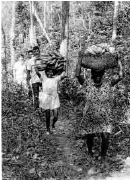
Abb. 95: Rückkehr von den Feldern, wo Mais, Maniok, Bananen, Reis, Baumwolle und anderes angebaut wird.

Offensive der Massenmedien: Auch das Fernsehen überbringt die herrschende Ideologie. Obwohl es in den Dörfern weder Trinkwasser noch Elektrizität gibt, hat ein Projekt Fernseher aufgestellt, die von Sonnenkollektoren gespeist werden. Nur wenige Programme richten sich jedoch an die Chiquitano und berücksichtigen dabei ihre Kultur und ihr Denken, kein einziges Programm vermittelt die indianischen Werte. Neben Lokalnachrichten aus dem Regionalzentrum werden vor allem nordamerikanische Serien und Spielfilme, Seifenopern und anderes von niedrigster Qualität gesendet. Die Erwachsenen in den Dorfgemeinden ignorieren meist diese Programme, doch die Jugend wird so in die glitzernde Konsumwelt eingeführt.